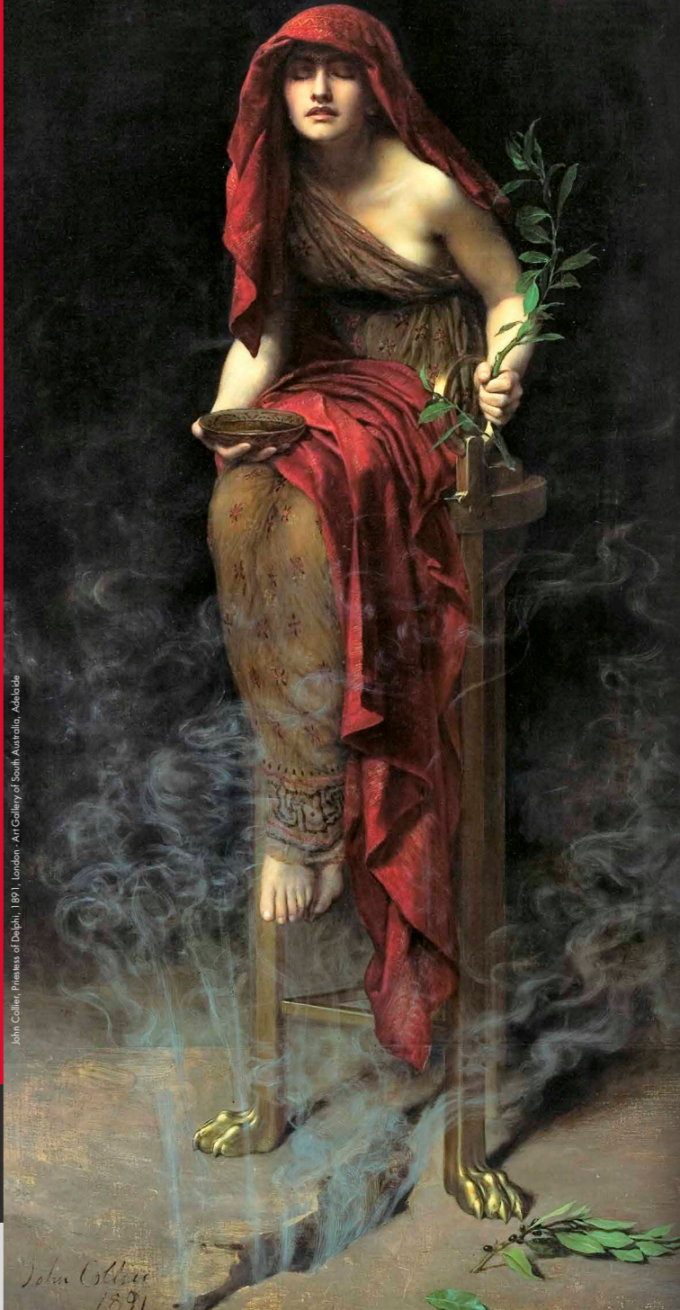
John Collier, Promessa di Delfini, 1891, London - Art Gallery of South Australia, Adelaide